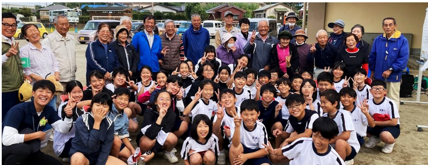
宮之浦老人クラブ・楠川寿大学の皆様方のお陰で、充実した大会になりました！