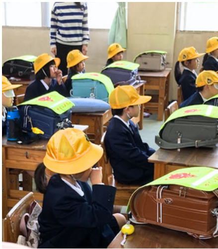
毎日がどきどきの連続です