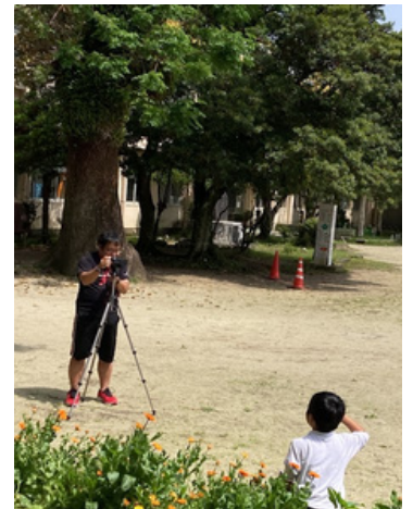
この時期、学級ではお一人一人の写真も撮っています