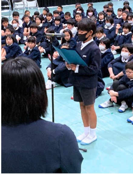
新任式での素晴らしい児童代表挨拶