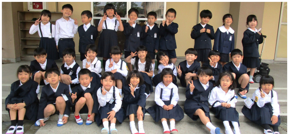
令和6年度、元気な28人が入学しました。入学2日目に集合写真を撮りました。これからよろしく願いします！

そして、これから出会う保護者や地域の方々との出会いに期待を膨らませています。出会いは人を成長させるきっかけのひとつです。本校は創立150周年を迎えます。これまで宮浦小学校を支えてくださった皆様と一緒に、そして新しいメンバーも加え、宮浦小学校とこの地域を盛り上げていけたらと思います。どうぞよろしく願いいたします。