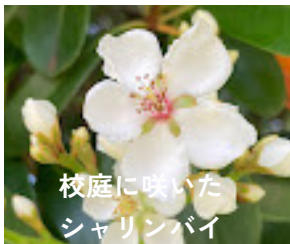
校庭に咲いた シャリンバイ