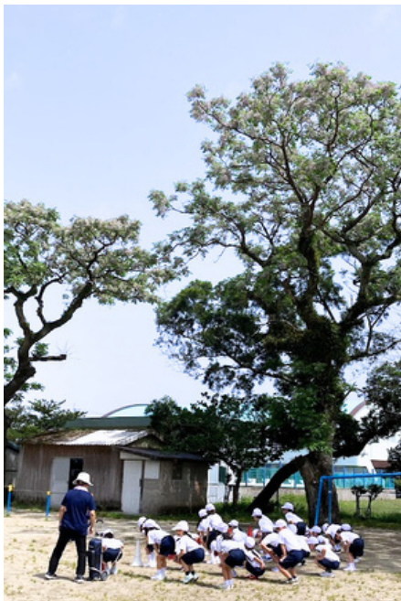
初めての「たいいく」